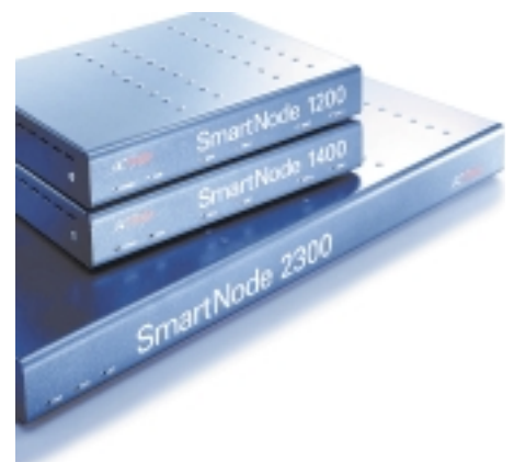
Design, Entwicklung und Produktion eines Gehäuses für ein Datenübertragungsgerät (Voice over IP)

Wir bringen Ihre Ideen mit Enthusiasmus in Form.