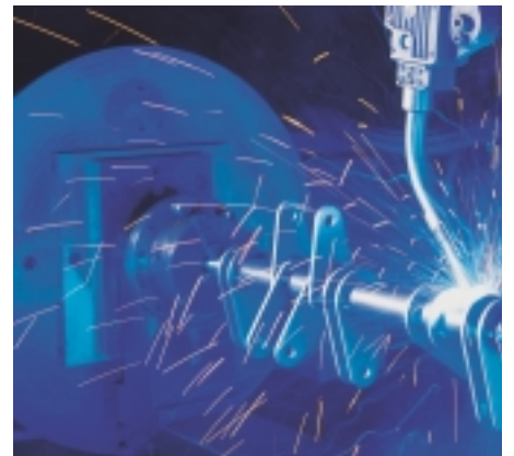
Antriebswelle zu Hochstromschalter auf Schweisroboter MIG-geschweisst

Wir verfügen über umfassendes Know-how für die Evaluation der richtigen Verbindungslösung. Ob Roboter-, Widerstands- oder Handschweissen, Nieten, Kleben oder Schrauben - wir fügen zusammen, was zusammen gehört. Egal, ob es sich um Stahl-, Aluminium- oder Buntmetallverbindungen handelt. Und Einzelkomponenten montieren wir zu kompletten, einbaufertigen Baugruppen.