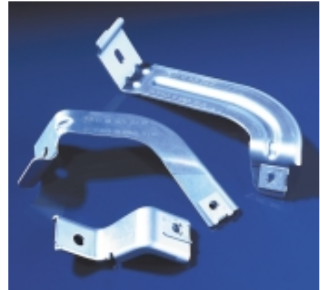
Halter aus AlMg 3 zur Befestigung von Unterbodenverkleidungen von Automobilen

Prozesssichere Werkzeuge sind die Basis für eine effiziente Serienproduktion. Alle notwendigen Werkzeuge werden durch unsere Werkzeugbau-Abteilung selbst produziert und gewartet. Dies garantiert Ihnen eine hohe Verfügbarkeit und sichert damit Ihre Investitionen langfristig.