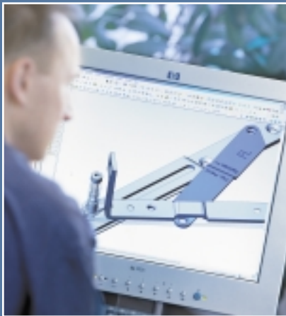
Konstruktion eines verdeckten Drehlagers für 3-flüglige Fenster auf 3D CAD Solid Works