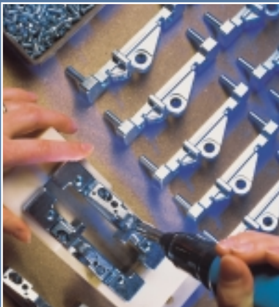
Montage eines Fensterbeschlages