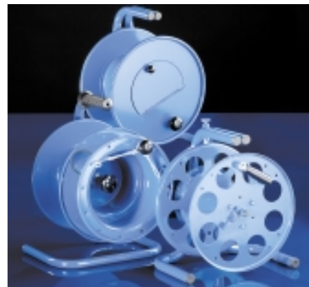
Kabelrollen für den Bevölkerungsschutz, die Polizei, Feuerwehr und zivile Anwendungen

Kunden aus den Bereichen Bevölkerungsschutz, Polizei, Feuerwehr oder Industrie schätzen seit Jahren die extrem robusten und damit wirtschaftlichen Systeme.