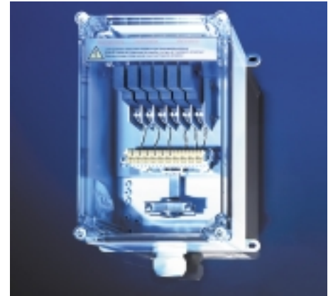
Trennkasten 20 kV für den Hochspannungsbereich in Elektrizitätswerken

Dabei verstehen wir Design nicht als Selbstzweck sondern als Instrument, höchste Produkt-Funktionalität und -Qualität mit wirtschaftlicher Produktion zu verbinden.