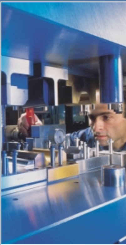
Alle Werkzeuge werden durch unseren Werkzeugbau produziert und gewartet