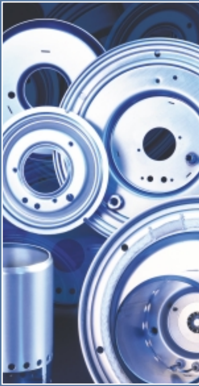
Einbaufertige Baugruppe zu Low-Nox-Brenner aus hochwarmfestem, rostfreiem Stahl (Alloy).